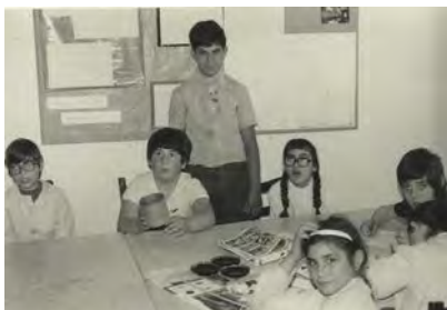
Alumnes de l'Escola Sant Miquel a l'aula i al pati del carrer dels Estudis

L'any 1976 S'elabora un projecte urbanístic per situar tots els serveis del Centre de Pedagogia Terapèutica Sant Miquel, que en aquell moment estaven situats a l'edifici del carrer dels Estudis, en uns terrenys de la Collada que pertanyien a la companyia municipal d'aigües i van ser cedits per l'Ajuntament de Vilanova i la Geltrú (plànol 1). En el projecte es contemplaven diferents edificis per cada servei del centre, taller (ja projectat i en vies de construir), pre-taller, escola i serveis centrals, amb espais reservats per a piscina i camp d'esports.